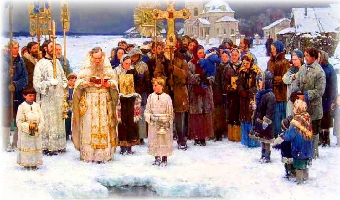
«Крещение», Антон Овсяников, 2002 г.

После всенощной делали углем начертание креста